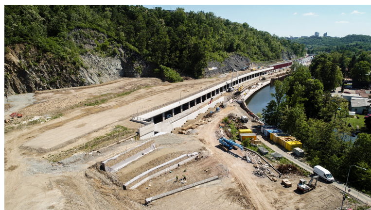
Vrchní část galerie.