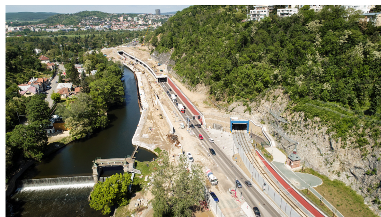
Vyústění tunelu a kaple sv. Antonína.