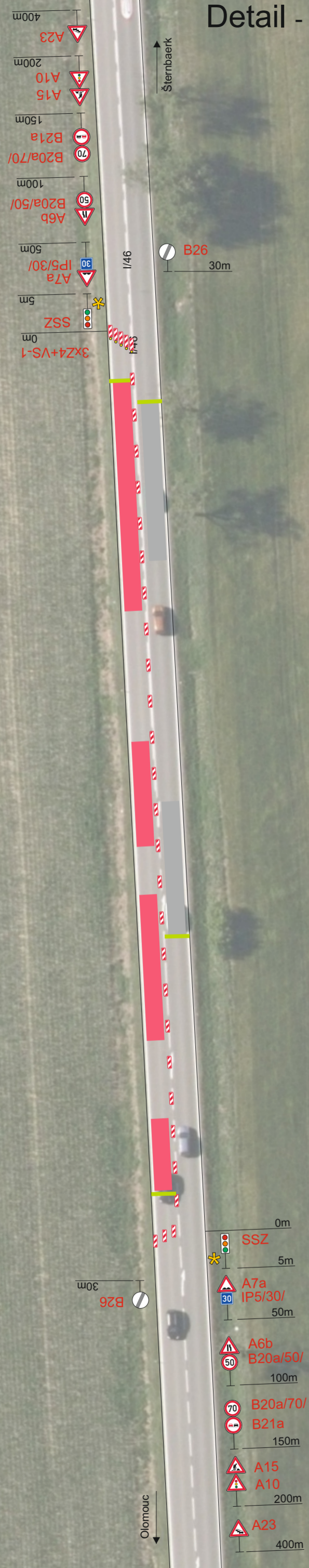
Detail - pokládka 1. polovina