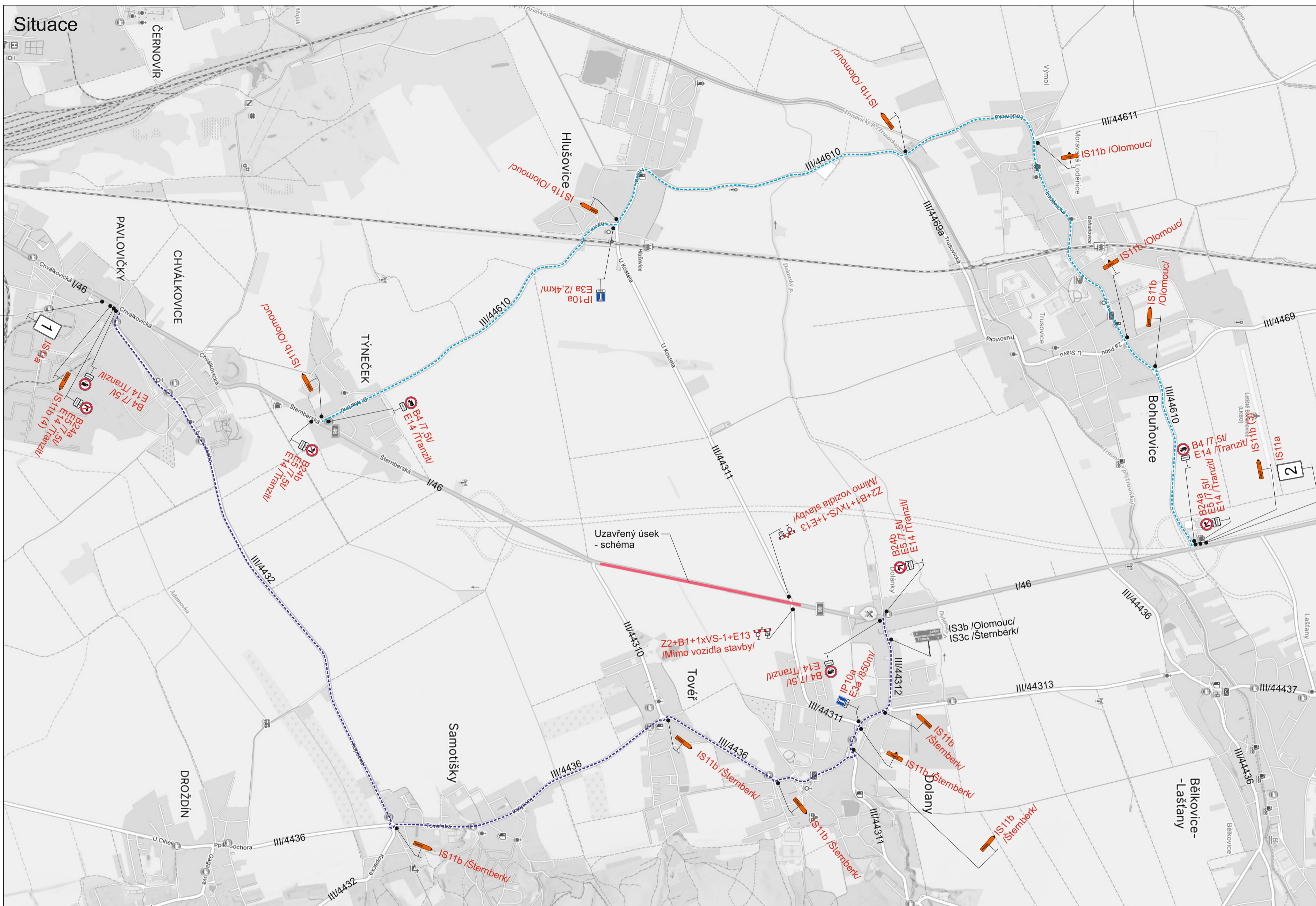
Schéma pracovního místa Etapa 1A